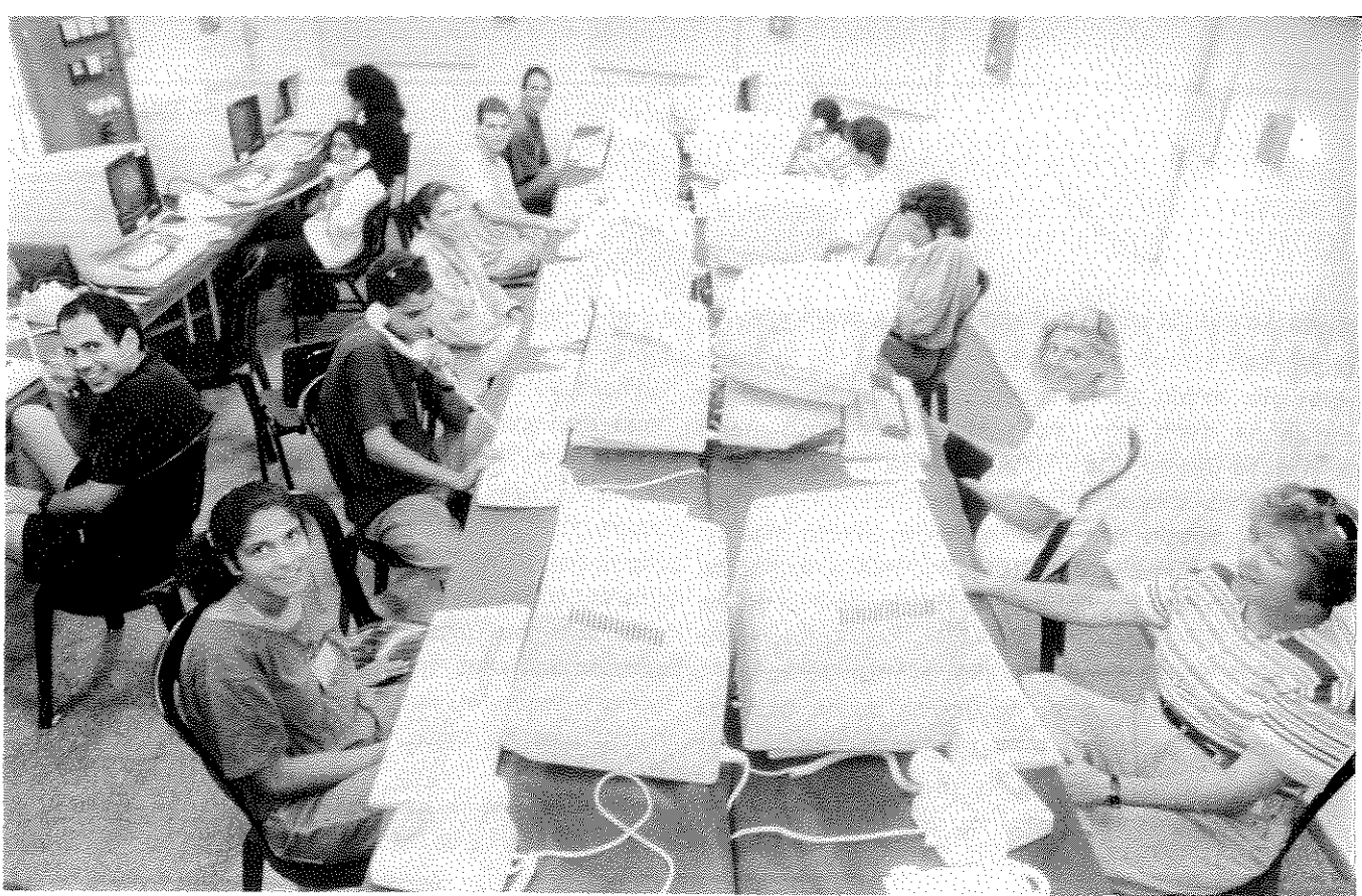
במשדרי מל"ם, אליהם הועברו תוצאות הבחירות בשביל ועדת הבחירות המרכזית